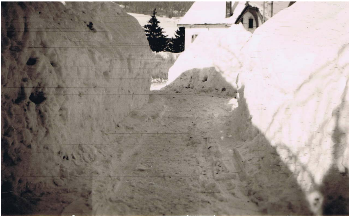
Vers 1963. Ce n'est pas encore le tunnel, mais presque. En face, la maison du Bugnon. Nous sommes ici devant la maison Rochat-Saïset.