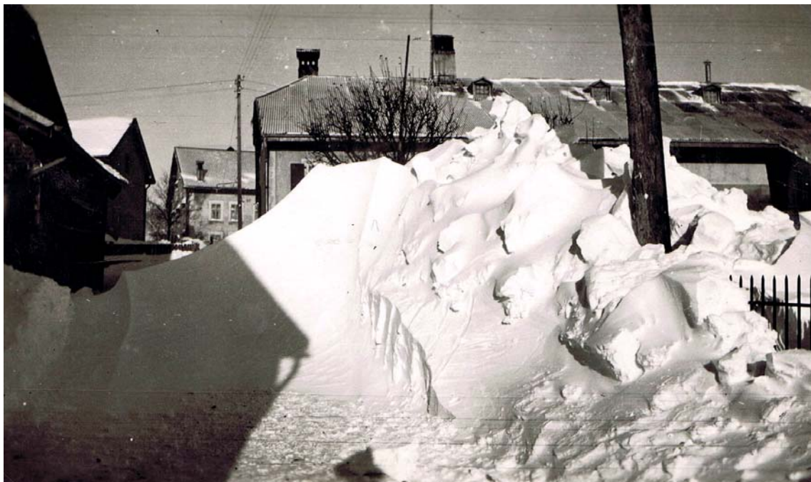
1934. La route des Chappes est fermée. À gauche, chez Pitôme, à droite chez Pedzi.

Nous avons tantôt parlé de ces bons vieux hivers d'antan. Nous vous proposons ici quelques images prises par divers en trois périodes du XXe siècle. Juste de quoi vous donner l'eau à la bouche !